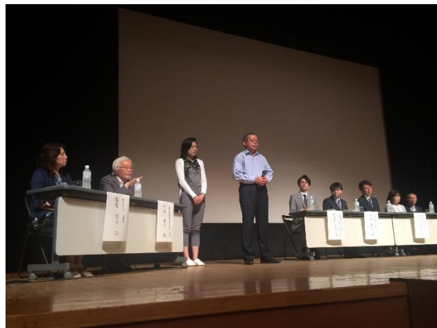
中国からの参加者